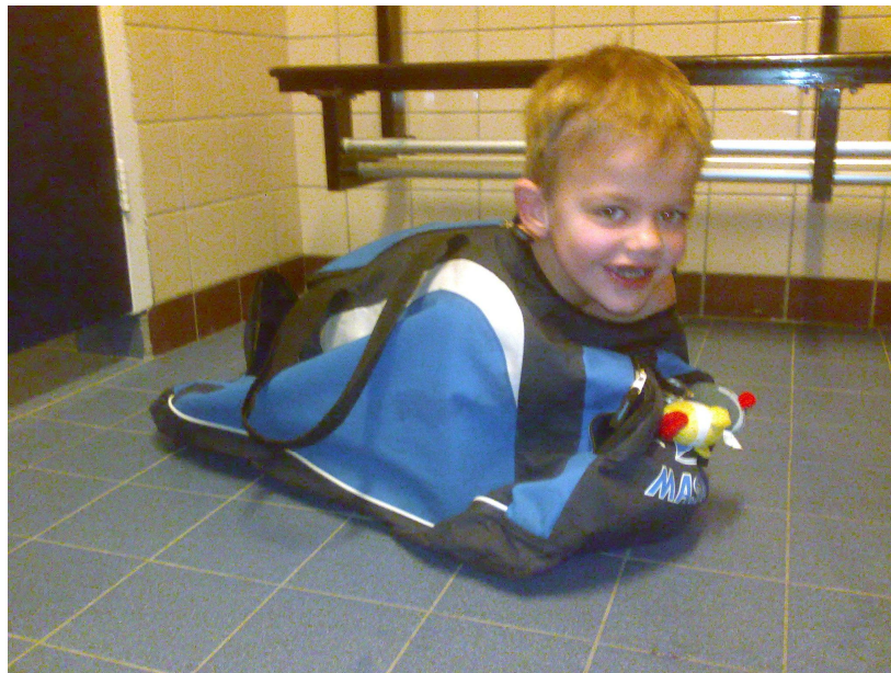
Past in iedere (sport)tas